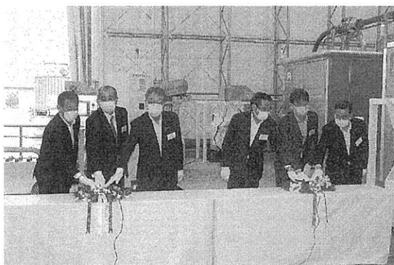
運転ボタンを押す関係者

バイオマス由来のプラスチック用原材料などの製造を行うための「レドックスマスター新型乾燥機」を設置し、5月19日にその運転開始式を開催した。